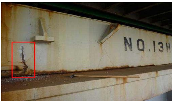
経年繰返し荷重による貨物倉頂部の割れ

18 各国では、 リスクが中程度の外国船には検査の実施間隔をリスクの高い外国船の3倍程度に、また、リスクの低い外国船の検査実施間隔は6倍程度に間隔を広げることを標準として、優良な船主の船舶管理を尊重する考えで、 今後早急に実施のための細目を取り決める予定です。 アジア太平洋地域では、経済成長による海上荷動き量の増加に伴い域内を航行する外国船が年平均6%～9%増えており、安全・環境に対するリスクの高い外国船に検査を重点化する必要がありました。