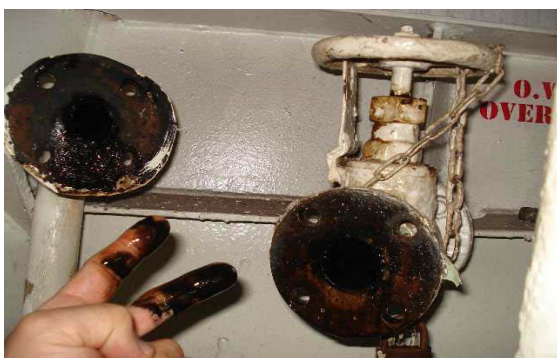
油水分離器作動不良による排水管汚損