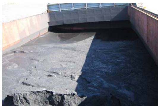
貨物倉ハッチカバーの欠陥による浸水