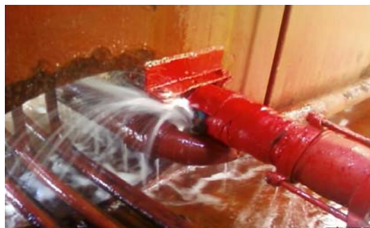
消火主管の腐食割れ